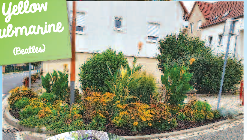
Yellow submarine (Beatles)