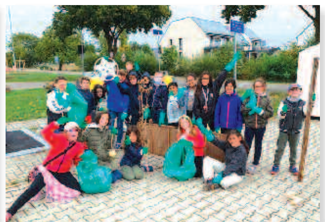
Nettoyons la nature classe de CE1