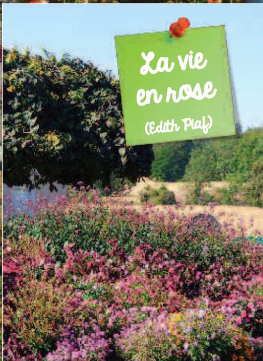
La vie en rose (Edith Piaf)