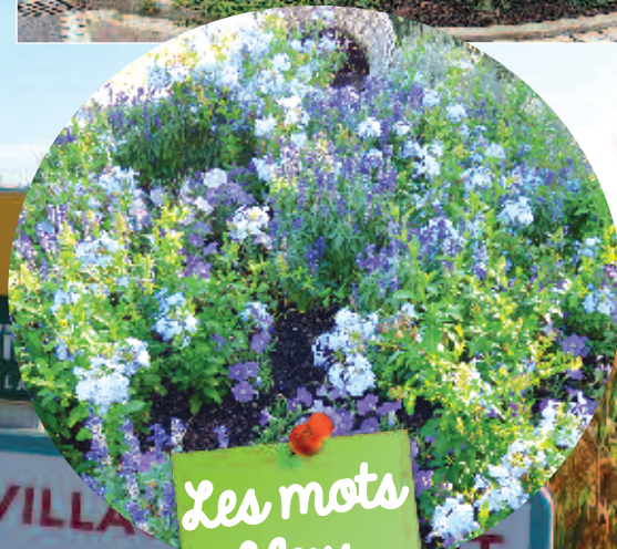
Les mots bleus (Christophe)