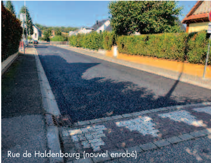
Rue de Haldenbourg (nouvel enrobé)

Un cédez le passage a été créé sur cette rue afin de sécuriser la sortie de la rue des Eglantines, les automobilistes sortant de celle-ci ayant jusqu'à présent une visibilité réduite.