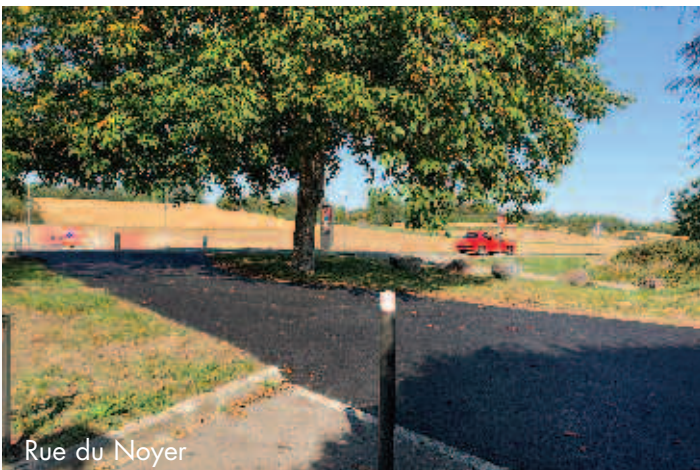
Rue du Noyer

La fin de la rue des Noyers a été aménagée en cheminement doux (piétons et cyclistes) afin de faire la jonction avec la piste cyclable qui relie Niederhausbergen et Mundolsheim.