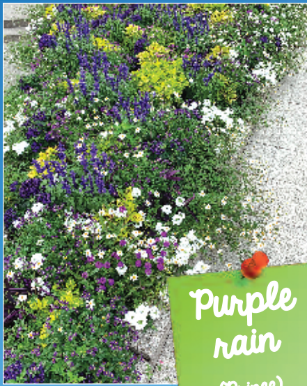
Purple rain (Prince)

Cette année aussi, 5 variétés de plantes estivales ont été choisies en vue de leur réutilisation au printemps 2021, et d'autres ont pu être replantées dès à présent sur les massifs pérennes.