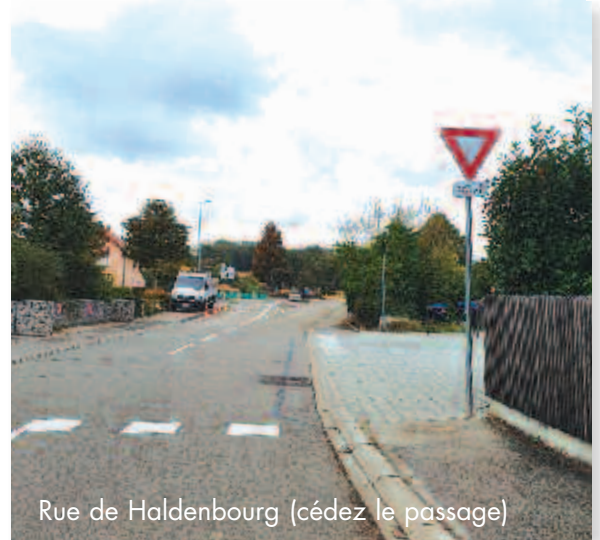
Rue de Haldenbourg (cédez le passage)