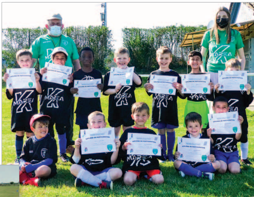
Tous les participants au Nieder Stage Foot ont reçu en cadeau un tee-shirt et un diplôme (ici les U7)

L'amélioration de la situation sanitaire au printemps a permis au FC Niederhausbergen d'organiser quelques événements toujours dans le strict respect des règles sanitaires. Ainsi, le FCN a réussi à adapter son traditionnel Nieder Stage Foot et a accueilli une quarantaine de jeunes durant une semaine pendant les vacances de Pâques. De plus, depuis la mi-mai, des journées découvertes sont proposées pour les jeunes afin de préparer la prochaine saison. Les 11, 12 et 13 juin, suite à l'autorisation des sports de contact en plein air, le club a même pu accueillir des rencontres amicales des U7 aux super-vétérans et proposer rafraîchissements et petite restauration aux spectateurs retrouvant ainsi les moments conviviaux qui ont tant manqué à tous.