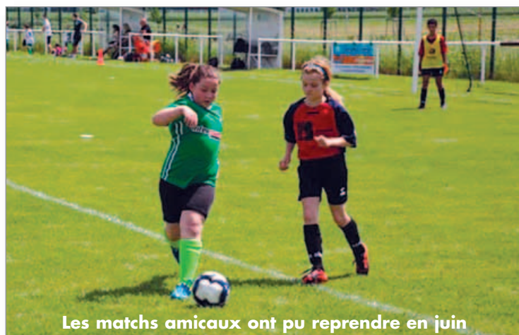
Les matchs amicaux ont pu reprendre en juin

Enfin, le club a préparé les 17, 18, 22 et 25 juin des animations foot à destination des élèves de 4 classes de l'école élémentaire Jules Verne.