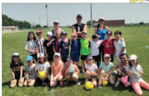
Une journée découverte du foot avec l'école élémentaire

Si les compétitions de football ont été suspendues pour l'ensemble de la saison 2020-2021 dès le mois de novembre, la pratique a tout de même été autorisée dès l'hiver. C'est avec beaucoup de plaisir que les licenciés du FC Niederhausbergen ont pu retrouver le chemin des terrains.