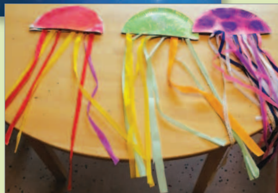
Activité méduses sur le thème Jules Verne (20 000 lieues sous les mers)