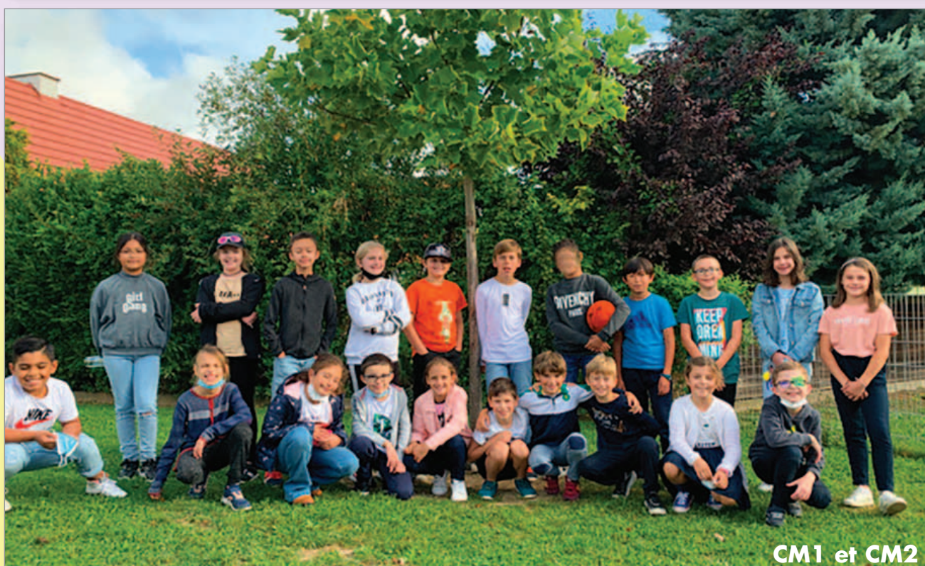
CM1 et CM2