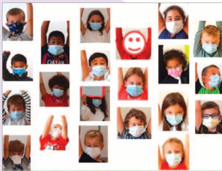
CE1 et CE2