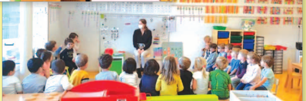
Moyenne et grande section