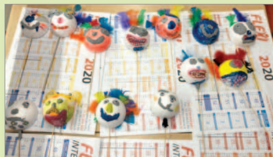
Activité marionnette organisée par notre apprenti