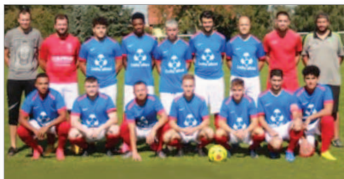
L'équipe fanion avant son match de coupe d'Alsace