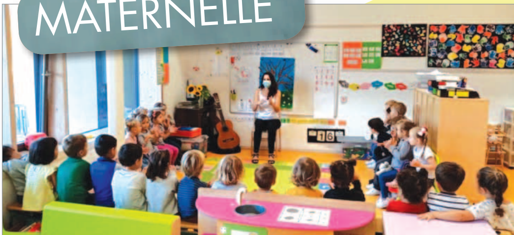
Petite et moyenne section