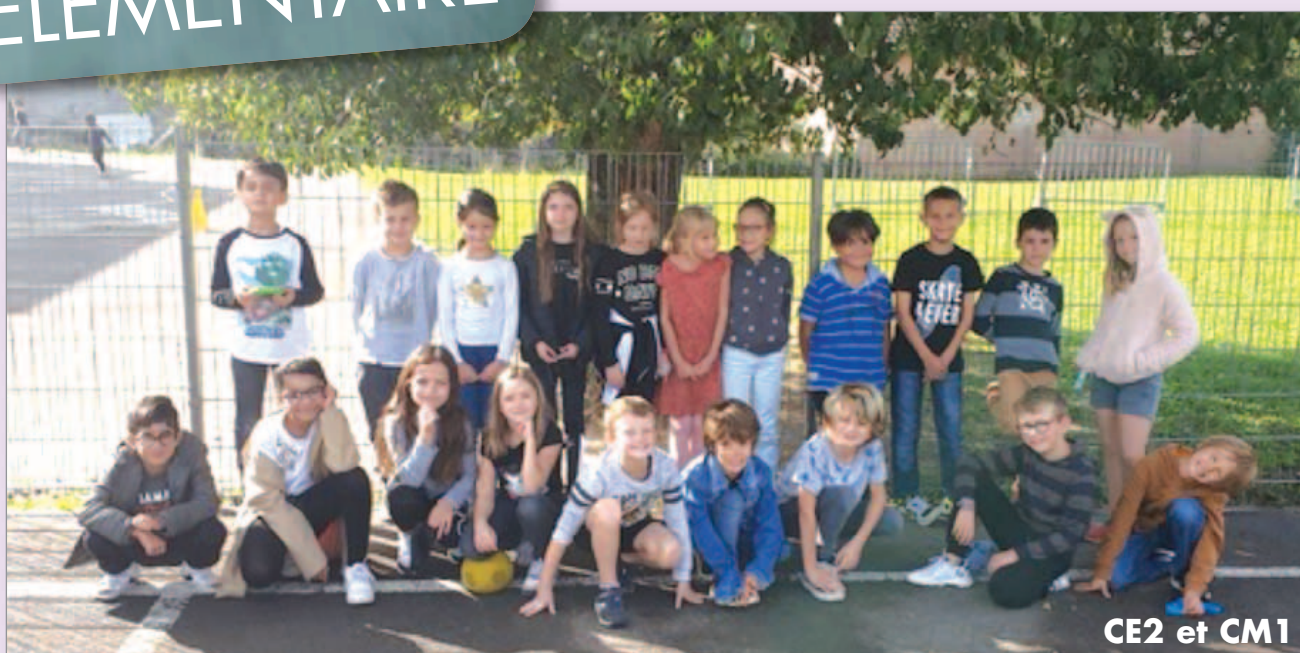
CE2 et CM1