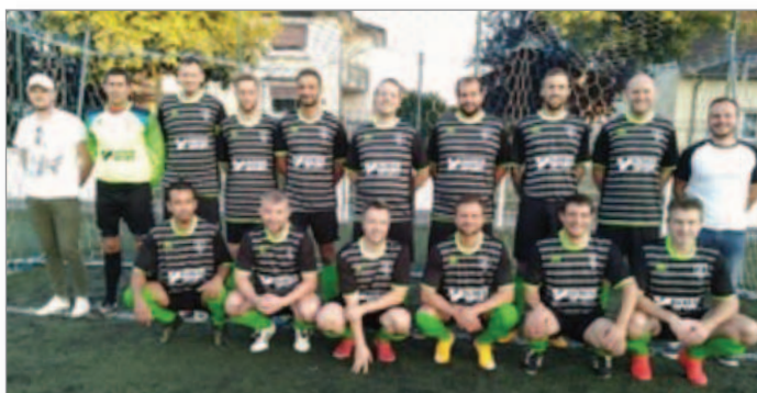
L'équipe vétéran saison 2021-2022