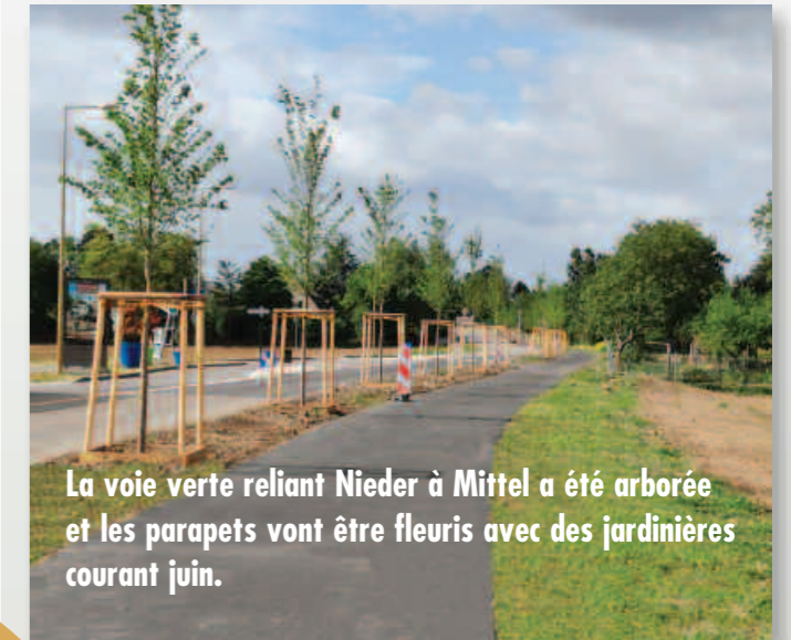
La voie verte reliant Nieder à Mittel a été arborée et les parapets vont être fleuris avec des jardinières courant juin.

RELIANT NIEDERHAUSBERGEN À MITTELHAUSBERGEN ET À MUNDOLSHEIM